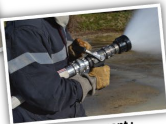
Le trio gagnant : Turbo-, Débi-, Magikador