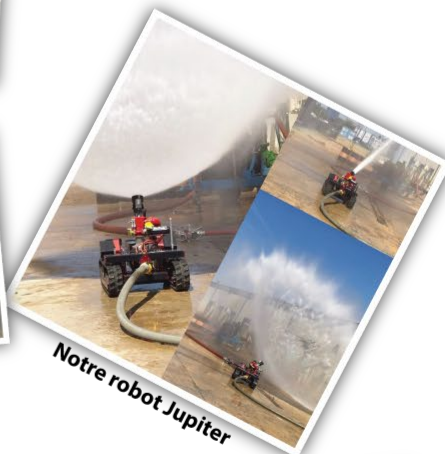
Notre robot Jupiter