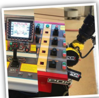
Systèmes de contrôle POK