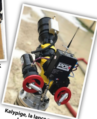
Kalypige, la lance motorisée la plus compacte