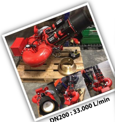
DN200 : 33.000 L/min