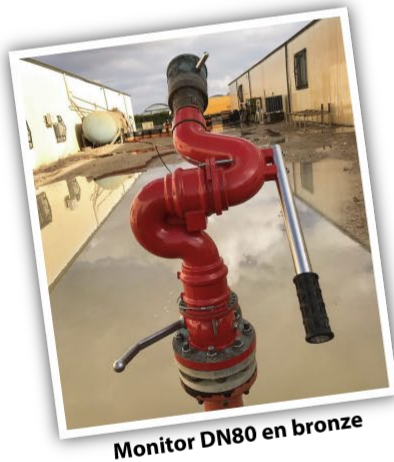
Monitor DN80 en bronze

A très vite chez nous ou chez vous et, encore une fois, très belle année à toutes et tous.