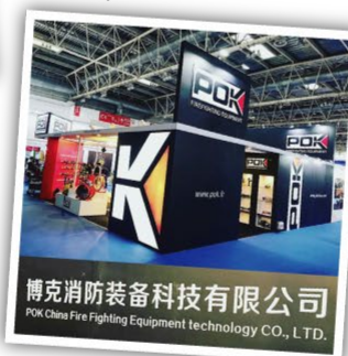
China Fire 2019